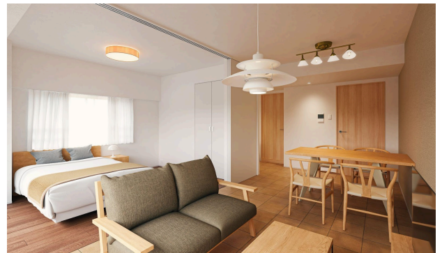
住戸イメージパース

単身世帯からDINKSをターゲットに、ペットとの共生（中型犬・2匹まで）やガーデニングなど、アクティブな生活をアシストする仕掛けを設えました。ペット対応の床材や壁紙を採用するとともに、リビングはビニル床タイルとすることで半屋外のような空間としました。ガーデニングを楽しんだり、リビングの一面をインナーテラスのようにお使いいただけます。間取りは、フルハイトの可動間仕切でワンルームとしても使える1LDKを中心に、最上階は一部スラブを解体し、下階とつなげることでーフバルコニー付きメゾネット住戸を計画しました。また、暮らしやすさにこだわり、収納計画や家電・家具の配置などを考慮、内装デザインは、ナチュラルで温かみのあるテイストとしました。