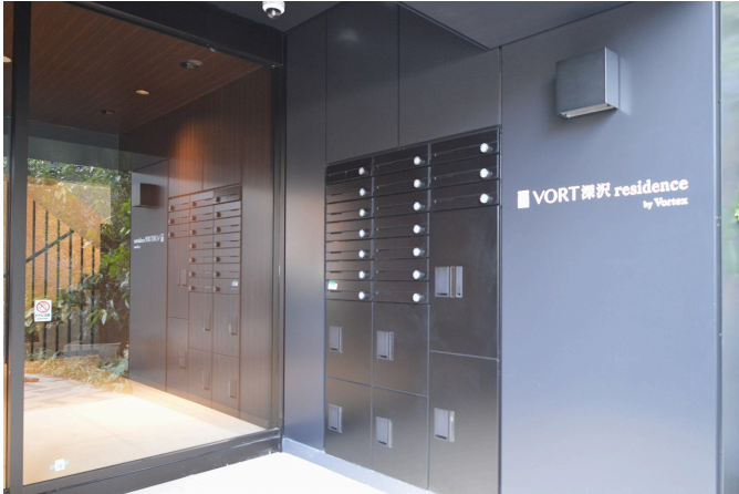
アフター：オートロックと宅配ボックスを新設