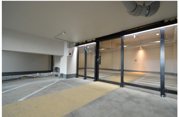
屋内駐輪場・バイク置き場