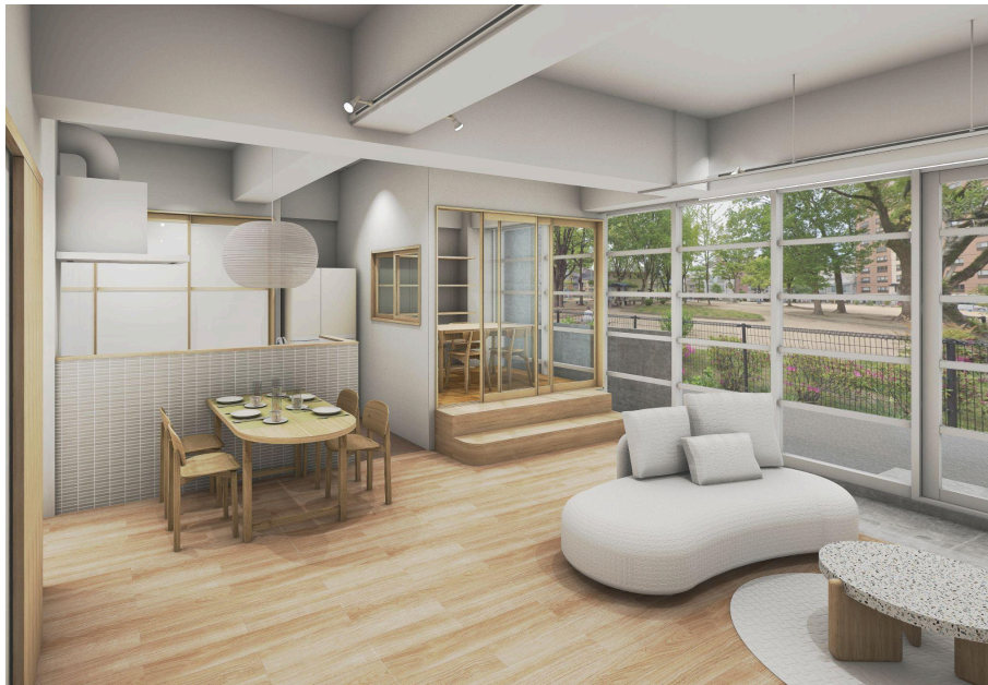
「リノべる。広島 横川ショールーム」のイメージパース。ジャパンディテイスを採用。 ※画像はイメージパースです。実際の状況とは異なる場合がございます。

本ショールームは、73.42㎡の中古マンションを2LDKにリノベーションした空間です。共働きで小さなお子さまのいる3人家族を想定し、家事ラク間取りや大容量収納で家事の時短を実現し、家族との団らんや趣味の時間がより豊かになる工夫満載のリノベーション空間を体感いただけます。