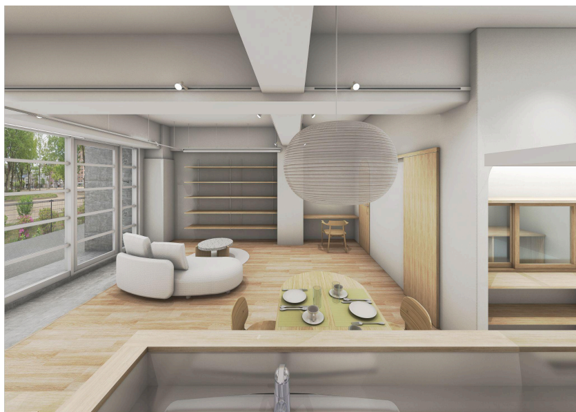
「リノべる。広島 横川ショールーム」のイメージパース。 ※画像はイメージパースです。実際の状況とは異なる場合がございます。